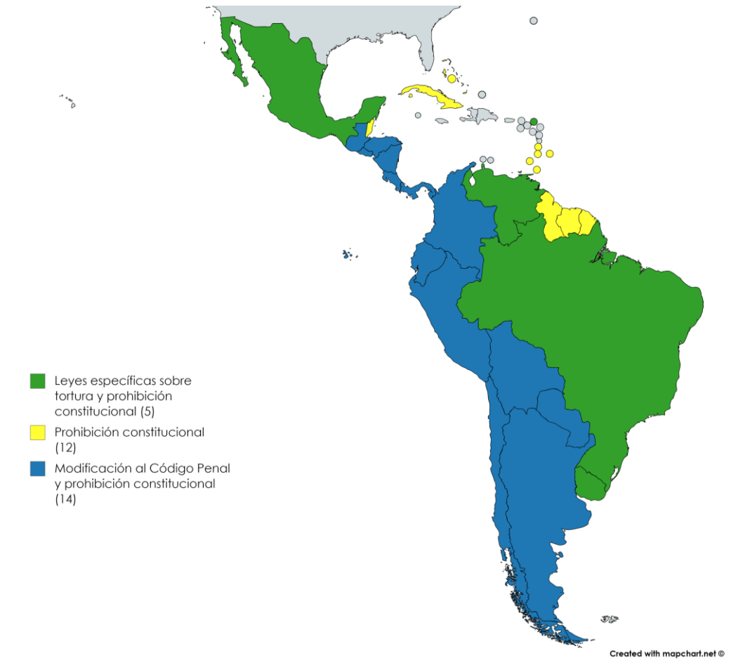
Imagen 1. Panorama de los enfoques legislativos nacionales relativos a la prohibición de la tortura.

El siguiente mapa provee un panorama de los enfoques que los Estados de América Latina y del Caribe adoptaron para prohibir y criminalizar la tortura y los malos tratos.