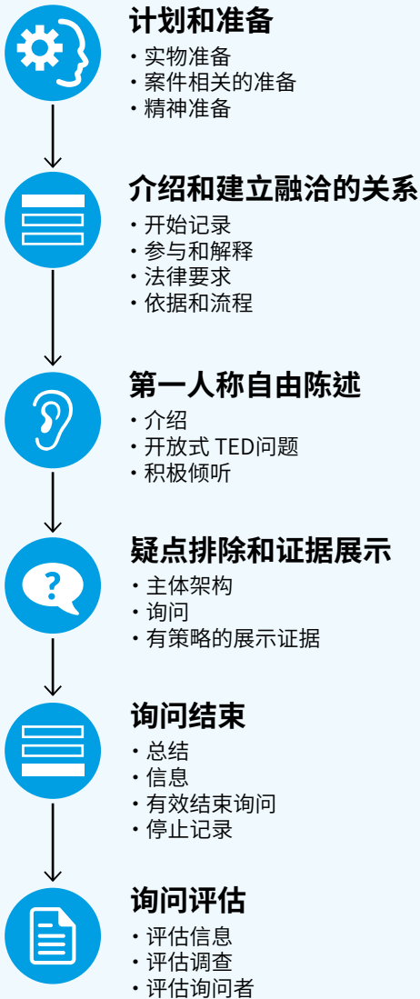
图1 – 挪威警察大学在C.R.E.A.T.I.V. 1 培训项目中的可视化P.E.A.C.E. 模型